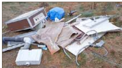
Entsorgung von kompletter Sanitäreinrichtung am Feldrand Rienau