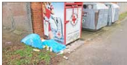
Hausmüllentsorgung am Altkleidercontainer in Fernbreitenbach

Leider ist auch im Gebiet der Stadt Werra-Suhl-Tal zunehmender Vandalismus zu verzeichnen. So werden z.B. regelmäßig Bänke, Schautafeln, Papierkörbe beschädigt oder so zerstört, dass eine Nutzung nicht mehr möglich ist. Die finanziellen Mittel, die für die Reparaturen oder für die Neuanschaffungen benötigt werden, könnten effektiver eingesetzt werden.