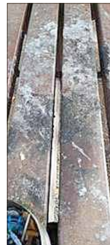
Angebrannter Tisch am Rastplatz Berka/Werra

Zuletzt zeigte sich die Zerstörungswut am Kamphaus in Gospenroda. So musste festgestellt werden, dass Scheiben zerschlagen, Silvesterknaller ins Gebäude geschmissen und ein installiertes Insektenhotel zerstört wurden. Dieses Gelände wird vom Forstamt Marksuhl in enger Zusammenarbeit mit der Umweltgruppe Gospenroda instandgehalten und zu einem Naturschutzzentrum ausgebaut. Es ist schade, dass die Zerstörungswut von bisher Unbekannten die gemeinnützige Arbeit vieler Freiwilliger zu Nichte macht.